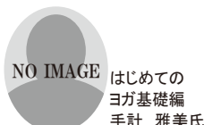
NO IMAGE はじめての ヨガ基礎編 手計 雅美氏