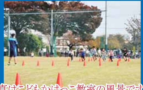
※この写真はこどもかけっこ教室の風景です